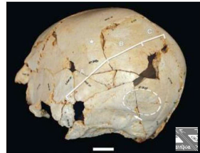
Reconstrucción del cráneo asimétrico de Benjamina-